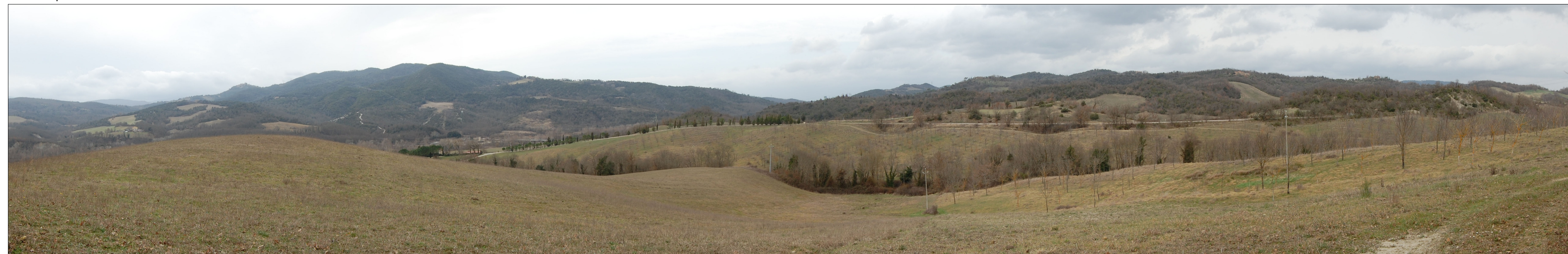
Punto di ripresa da Rudere Casottaccio - Località Piettorri - verso Ovest

SCHEMA DI MATRICE PAESAGGISTICA Approfondimento dei caratteri morfotopologici del sistema agro ambientale della matrice paesaggistica (Approfondimento Tavola B09)